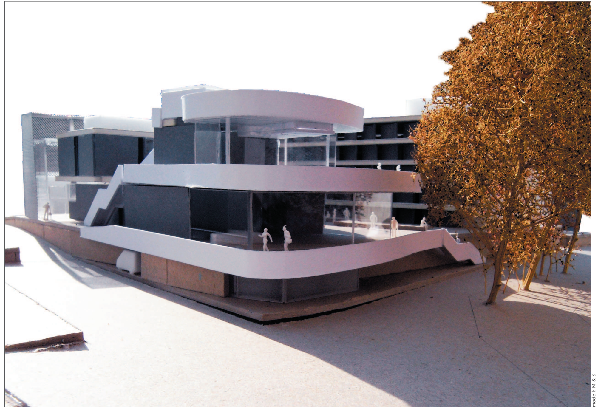
modell: M & S