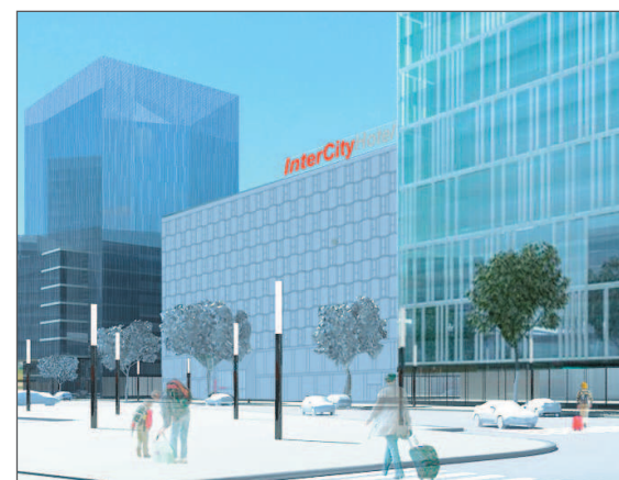
visualisierung: Wolfgang Beyer

Auftraggeber: BIG E&V Architekten: arenas.basabe.palacios. zusammen mit Mascha & Seethaler Planungsbeginn: Februar 2011